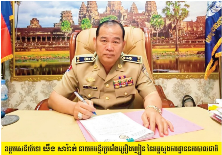
ឧត្តមសេនីយ៍ទោ ឃីង សាវ៉ាន់ នាយកមន្ទីរប្រឆាំងគ្រឿងញៀន នៃអគ្គស្នងការដ្ឋាននគរបាលជាតិ