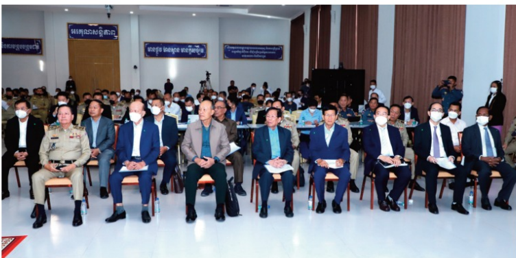
តមកពីទំព័រ ១៦ គ្រោះថ្នាក់ចរាចរណ៍ ឆ្នាំ២០២២ កើនឡើង..

ស្ថានភាពគ្រោះថ្នាក់ ៩ភាគរយ ប្រសិនបើ ៤ភាគរយ ដង្កូវ ១ភាគរយ ។