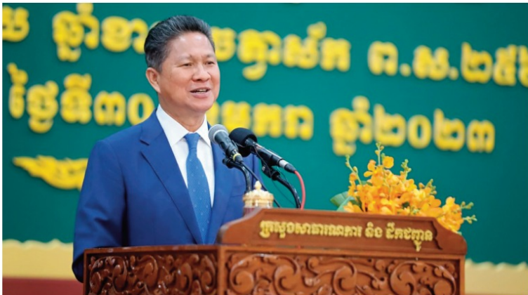
ឯកឧត្តម ស៊ុន ចាន់ថុល ទេសរដ្ឋមន្ត្រី រដ្ឋមន្ត្រីក្រសួងសាធារណការ និងដឹកជញ្ជូន

នាព្រឹកថ្ងៃទី៣០ ខែឧសភា ឆ្នាំ ២០២៣ សម្តេចក្រឡាហោម ស ខេង ឧបនាយករដ្ឋមន្ត្រី រដ្ឋមន្ត្រីក្រសួងយុត្តិធម៌ និងជាប្រធានគណៈកម្មាធិការជាតិសុវត្ថិភាពចរាចរណ៍ផ្លូវគោក(គ.ស.ច.គ) បាន អញ្ជើញដឹកនាំកិច្ចប្រជុំបូកសរុបលទ្ធផល ការងារសុវត្ថិភាពចរាចរណ៍ផ្លូវគោកឆ្នាំ ២០២២ និងទិសដៅការងារឆ្នាំ២០២៣ នៅសាលប្រជុំក្រសួងសាធារណការ និង ដឹកជញ្ជូន ។