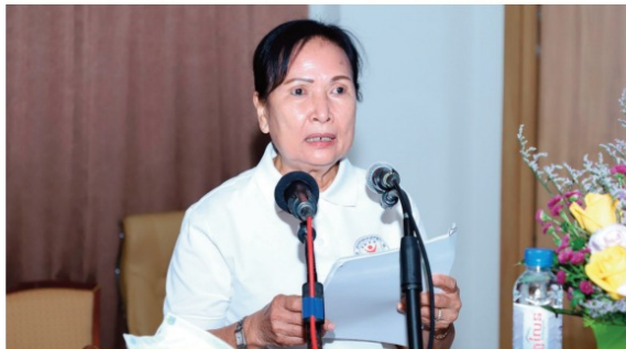
លោកជំទាវ មីន ហង់រារី រដ្ឋមន្ត្រីក្រសួងសាធារណការ និងដឹកជញ្ជូន

នាព្រឹកថ្ងៃទី៣០ ខែឧសភា ឆ្នាំ ២០២៣ សម្តេចក្រឡាហោម ស ខេង ឧបនាយករដ្ឋមន្ត្រី រដ្ឋមន្ត្រីក្រសួងយុត្តិធម៌ និងជាប្រធានគណៈកម្មាធិការជាតិសុវត្ថិភាពចរាចរណ៍ផ្លូវគោក(គ.ស.ច.គ) បាន អញ្ជើញដឹកនាំកិច្ចប្រជុំបូកសរុបលទ្ធផល ការងារសុវត្ថិភាពចរាចរណ៍ផ្លូវគោកឆ្នាំ ២០២២ និងទិសដៅការងារឆ្នាំ២០២៣ នៅសាលប្រជុំក្រសួងសាធារណការ និង ដឹកជញ្ជូន ។