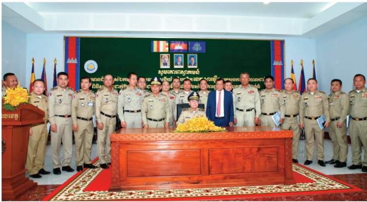
តាមកំណត់ ២២

ទីភ្នាក់ងារចាក់ប្រាក់ប្រើប្រាស់ប្រព័ន្ធនៃ ០៣ខ្សែ បំពាក់សម្ភារ ឧបករណ៍ យ៉ាងរឹងមាំ ត្រូវបាន កម្ពុជា គ្រឿងបំពាក់សម្ភារ គ្រឿង សម្ភាររឹង កុ កៅអី ដំបូងជាតិ និងដំបូង ដើមឈើចម្រុះ ដូចជានូវទៀត សមិទ្ធផល ទាំងនេះបានចំណាយថវិកាសម្រាប់សាងសង់ និងជួសជុលសរុបចំនួន ៦៦៥៥៤៩៤៩ ដុល្លារអាមេរិក ដោយមិនប្រើប្រាស់ ថវិកាប្រចាំឆ្នាំនោះទេ ដោយថវិកានេះ បានមក ពីការរៀបចំឧបត្ថម្ភរបស់សហប្រតិបត្តិការ និង ក្រុមហ៊ុននានា តាមរយៈការរំពារនាវា ចូលរួមរកវិធីសាសនាសម្រាប់ការ និង ជាពិសេស ឯកឧត្តម នាយឧត្តមលេនីយ៍ ខេង សុខុម រក្សាស្នូលការអនុវត្តការងារ ជាតិ ដែលតែងតែជួយឧបត្ថម្ភគាំទ្រក្នុង សកម្មភាពសាងសង់នេះ ។