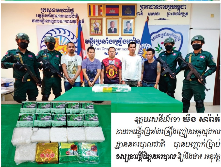
ឧត្តមសេនីយ៍ទោ ឃីង សាវ៉ាន់ នាយកមន្ទីរប្រឆាំងគ្រឿងញៀនអគ្គស្នងការដ្ឋាននគរបាលជាតិ បានបញ្ជាក់ប្រាប់ ស្សៀនសាវ្តីដ៏គួរគោរព ឱ្យដឹងថា៖ អនុវត្ត

តាមគោលការណ៍ដឹកនាំដ៏ខ្ពង់ខ្ពស់របស់ ឯកឧត្តម នាយឧត្តមសេនីយ៍ សន្តិបណ្ឌិត អគ្គស្នងការនគរបាលជាតិ និងក្រោមការ ដឹកនាំបញ្ជាផ្ទាល់ពី ឯកឧត្តម នាយឧត្តម សេនីយ៍ អគ្គស្នងការរងនគរបាលជាតិ ទទួល ផែនការប្រឆាំងគ្រឿងញៀន ឧត្តមសេនីយ៍ឯក ប្រធាននាយកដ្ឋាន កណ្តាលនគរបាល យុត្តិធម៌ក្នុងខែកុម្ភៈ កន្លងមកនេះ មន្ទីរប្រ ឆាំងគ្រឿងញៀនបានប្រមូលផ្តុំកម្លាំង និងបើកកិច្ចប្រតិបត្តិការបង្ក្រាបបទល្មើស គ្រឿងញៀន បានចំនួន ៥៨០ករណី ឃាត់ខ្លួន ១.៤០០នាក់ ( ប្រាំ ៤ករណី ) និង៣០នាក់ ឃាត់ខ្លួន ៣០នាក់នាក់ ( ប្រាំ០១នាក់ ) ក្នុងនោះមាន៖ ជនជាតិខ្មែរ ចំនួន១.៣៧៧នាក់ ( ប្រាំ៤០នាក់ ) វៀតណាម ០២នាក់ ( ប្រាំ០១នាក់ ) ថៃ ០១នាក់ មិន ២៦នាក់ ( ប្រាំ០២នាក់ ) មិនកើត ០៤ នាក់ និង៣០នាក់ ឃាត់ខ្លួន ៣០នាក់ ប្រាំ០១នាក់ ក្នុងនោះជនជាតិ ( មិន០១ និង កូរ៉េខាងត្បូង០១ ) ចាប់យកសារធាតុញៀន មានទម្ងន់សរុប ៣០គ.ក្រ ៣១៦,៦៤ក្រាម ក្នុងនោះមាន៖ ( មេក់ហ្វេកាដ៍ន ICE ១០ គ.ក្រ ៧៩៤,១៣ក្រាម មេក់ហ្វេកាដ៍ន WY ១៥,៧៩ក្រាម មេកាដ៍ន ៥គ.ក្រ ៩៥៩,៤៤ក្រាម វីធីស្តារី ១៣គ.ក្រ ៥៣១,៩០ក្រាម នីមេតាហ្វេប្រាម ១០, ៩៤ក្រាម ដើមកញ្ឆា ១.៩៧៦ដើម ប្រមាស់ ផេរ៉ាប្រាម សង្ហារៈ និងទ្រព្យសម្បត្តិ ពាក់ព័ន្ធបទល្មើស មានរយៈពេល ១៤គ្រឿង ដុំក្នុង ១៥៩គ្រឿង ទូរស័ព្ទ ៥០៤គ្រឿង ដំកើរ ២៧គ្រឿង អាវុធន្ត ០៣ដើម លុយខ្មែរ ៦,៧០០,៥០០ លុយវីថ ១.៤០០ បាត និងឧបករណ៍ សង្ហារៈមួយចំនួន ។ ទន្ទឹមនេះគ្រប់បណ្តាករណីទាំងអស់