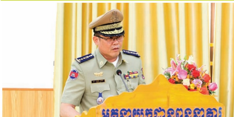
ឯកឧត្តម ឧត្តមអគ្គនាយកដ្ឋានពន្ធនាគារ លេខ១ សន នៃម សាវុធី អគ្គនាយក នៃអគ្គនាយកដ្ឋានពន្ធនាគារ