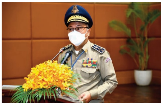
ឯកឧត្តម នាយឧត្តមសេនីយ៍ មាស វិវិទ្ធ អគ្គលេខាធិការ នៃអគ្គលេខាធិការដ្ឋានអាជ្ញាធរជាតិប្រយុទ្ធប្រឆាំងគ្រឿងញៀន