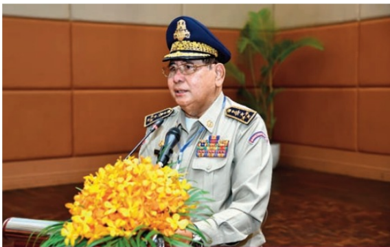
ឯកឧត្តម នាយឧត្តមសេនីយ៍ ម៉ក់ ស៊ីន អគ្គស្នងការរងនគរបាលជាតិ