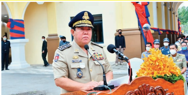
ឯកឧត្តម នាយឧត្តមសេនីយ៍ សេង យូរ៉េន អគ្គនាយកនៃអគ្គនាយកដ្ឋានកស្ថភាព និងហិរញ្ញវត្ថុ ក្រសួងមហាផ្ទៃ