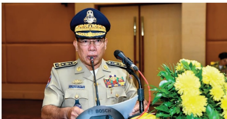
ឯកឧត្តម នាយឧត្តមសេនីយ៍ គៀត ច័ន្ទចារិន្ទ អគ្គនាយកនៃអគ្គនាយកដ្ឋានអន្តោប្រវេសន៍