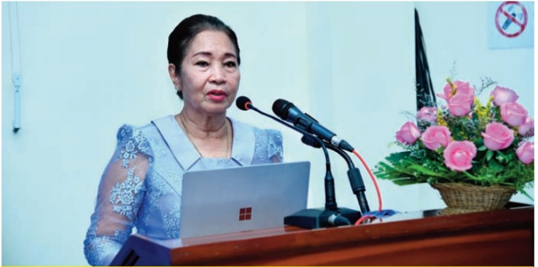
លោកជំទាវ ជូ ម៉ីន អេង រដ្ឋមន្ត្រីក្រសួងយុត្តិធម៌ និងជាអនុប្រធានអចិន្ត្រៃយ៍ គ.ជ.ប.ជ

សម្តេចក្រឡាហោម និងក្រុមប្រឹក្សាប្រជាពលរដ្ឋ ការបង្កើន និងផ្គត់ផ្គង់គ្រួសារប្រជាពលរដ្ឋ ក្នុងតំបន់បិទទ្វារ គំរាម និងឧបត្ថម្ភគ្រួសារ ដែលមានអ្នកគ្រប់គ្រងឬមានអ្នកស្លាប់ដោយ ជំងឺកូវីដ-១៩ ជាដើម ។