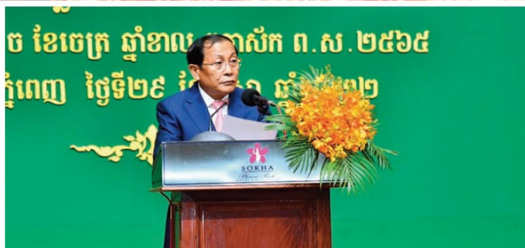
ឯកឧត្តម សង់ សេដ្ឋា រដ្ឋមន្ត្រីទទួលបន្ទុកការងារក្រសួងមហាផ្ទៃ និងជាសមាជិកនៃ (គ.ប.ប)